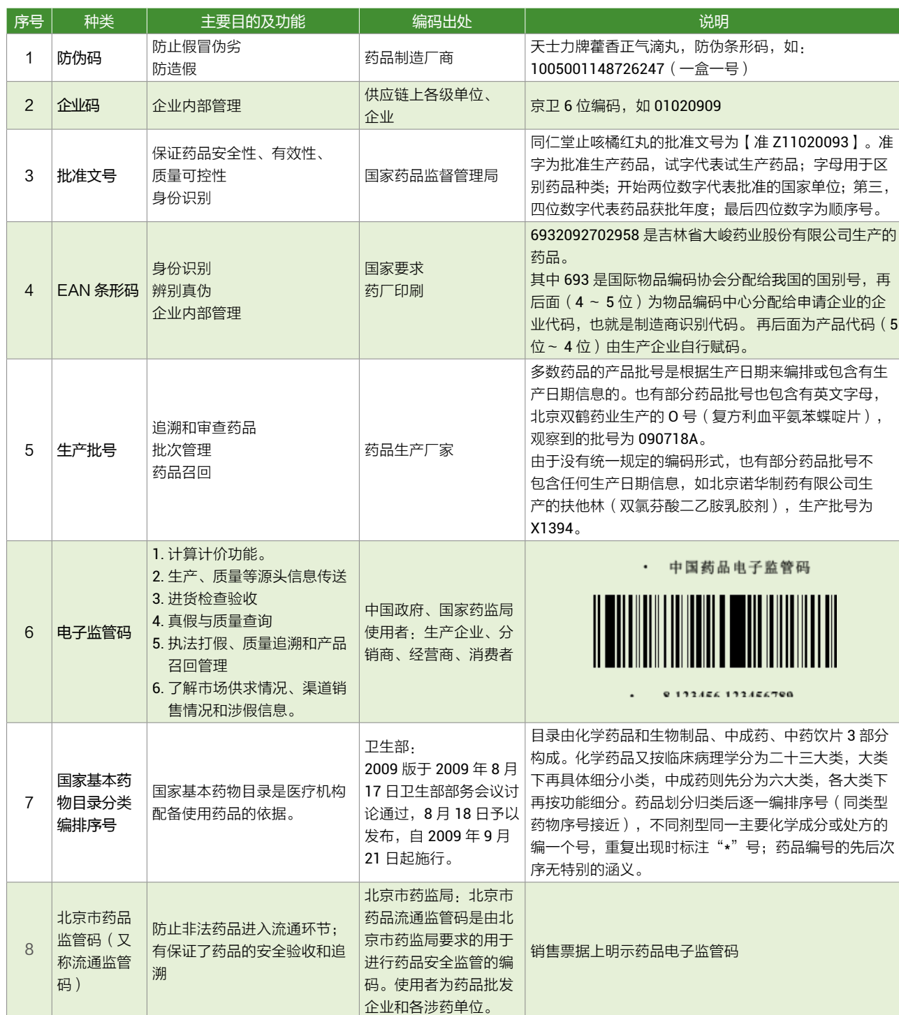
表 2: 中国药品主要编码种类介绍