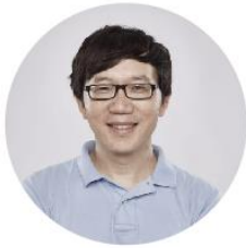
漆远 博士 首席科学家 蚂蚁金服副总裁