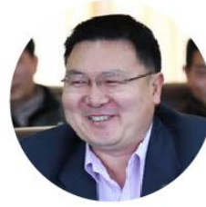
郑方 教授 清华大学信息技术研究院副院长