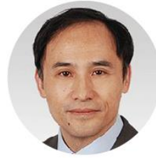
祝守宇 教授 航天科工集团航天云网副总裁