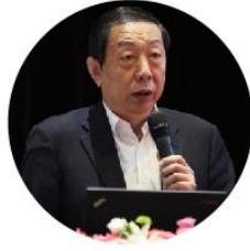
韩亦舜 教授 清华大学数据科学院执行副院长