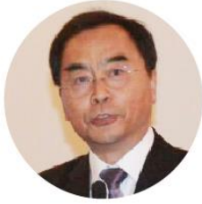
赵平 教授 清华大学中国企业研究中心主任