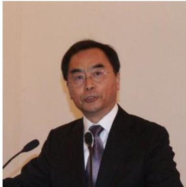
赵平 中国企业研究中心主任

赵平博士，现任清华大学经济管理学院市场营销系教授、博士生导师、中国企业研究中心主任；曾任市场营销系主任、《营销科学学报》主编和理事长、中国市场学会学术委员会主任、以及若干政府部门和企业的特聘顾问。